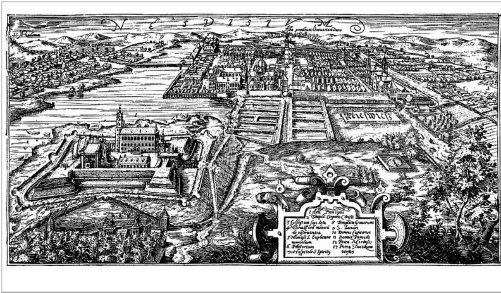
Ил. 7. Несвиж начала XVII столетия на гравюре Томаша Маковского.