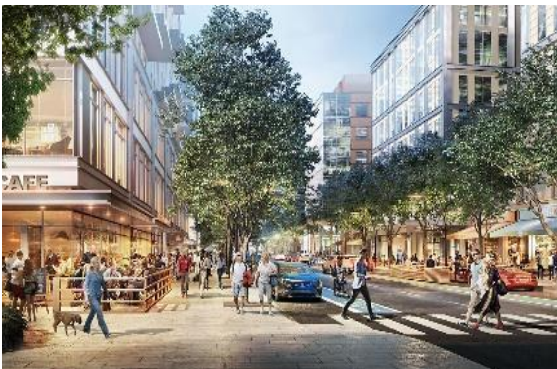
Fig. 2. Illustration of Third Urbanism.