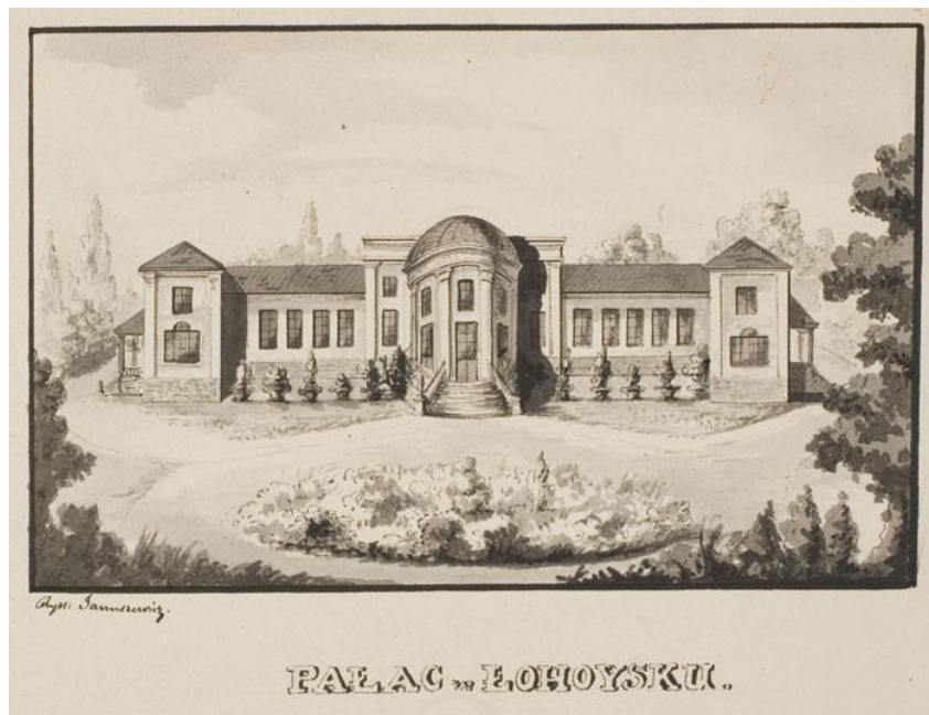
Ил. 9. Марцелий Янушевич. Дворец Тышкевичей. Логойск. Из фондов библиотеки Вильнюсского университета. Приб. 1957.