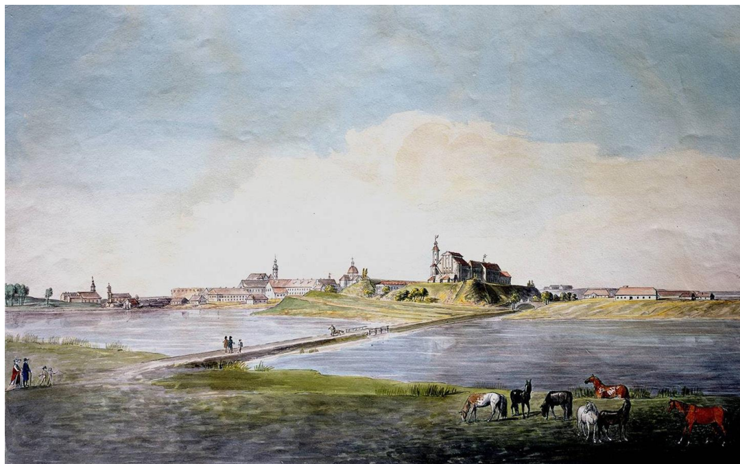
Ил. 5. Юзеф Пешка. Акварель. Вид замка. Первая половина XIX в.