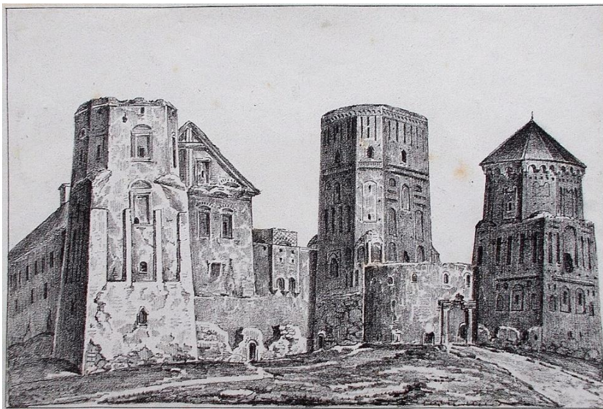
Ил. 1. Мирский замок. Литография с рисунка Ф. М. Сабешанскага. Варшава, 1849.

иллюстрацию на форзаце, выполненную виленским художником Канутием Русецким (1801–1860) и представлял Мирский замок со стороны его главного входа, со стаффажной группой людей и барбаканом – полукруглой башней, характерной для белорусской архитектуры XVII века, но не восстановленной при реконструкции Мирского замка в 2010 году. Рисунок Русецкого стал основой литографии для форзаца книги не только Сырокомли, но и ещё одного автора, Ф. Сабещанского (ил. 1). Серия рисунков Русецкого 1844–1846 годов, куда входил этюд Мирского замка, не была известна белорусским историкам искусства. В 2013 году всю серию показали на выставке в уже восстановленном замковом комплексе Мир (Навагрудскі край, 2013).