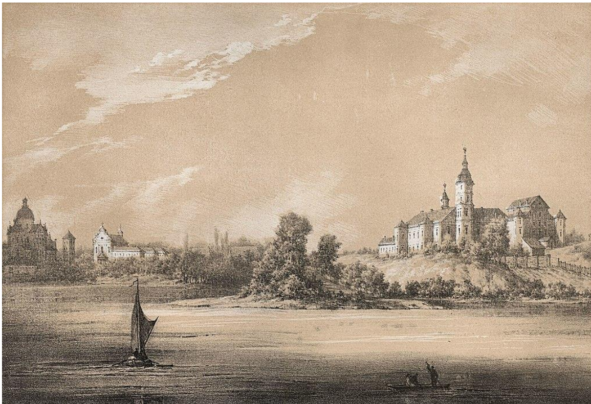
Ил. 3. Наполеон Орда. Иезуитский костёл (слева) и дворец Радзивиллов (справа), XIX век

Сыракомля въезжает в Несвиж с той его части, которая на сегодняшний день, закрыта для путешественников. Она составляла один из четырёх видов города, открывающийся одновременно на замок, городские храмы, и реку Уша, которая часто мелела, поскольку её водой наполняли рвы замка. Сейчас сохранилась одна единственная панорама Несвижа со стороны предместья Казимеж. Она являет собой тот редкий образец разворачивающегося перед зрителем картины городских строений: замка князей Радзивиллов XVI–XIX веков, иезуитского храма XVI века, въездной брамы XVIII века и бенидиктинского монастыря XVI–XVIII веков, стоящих в линию вдоль сегодня полноводной реки Уша (ил. 3).