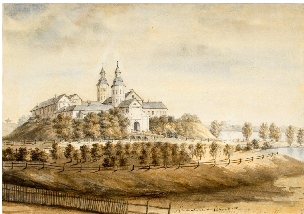
Ил. 6. Наполеон Орда. Несвижский замок

Таким живописным строением, кажется, замок Радзивиллов на цветном рисунке 1861 года художника Шклевика. Всё что до нас дошло от него – это оставленная на работе подпись. Возможно, он был учителем рисования в каком-то учебном заведении в Несвиже или в его окрестностях. Пока мои поиски имени и дополнительной информации об этом художнике не увенчались успехом. На рисунке