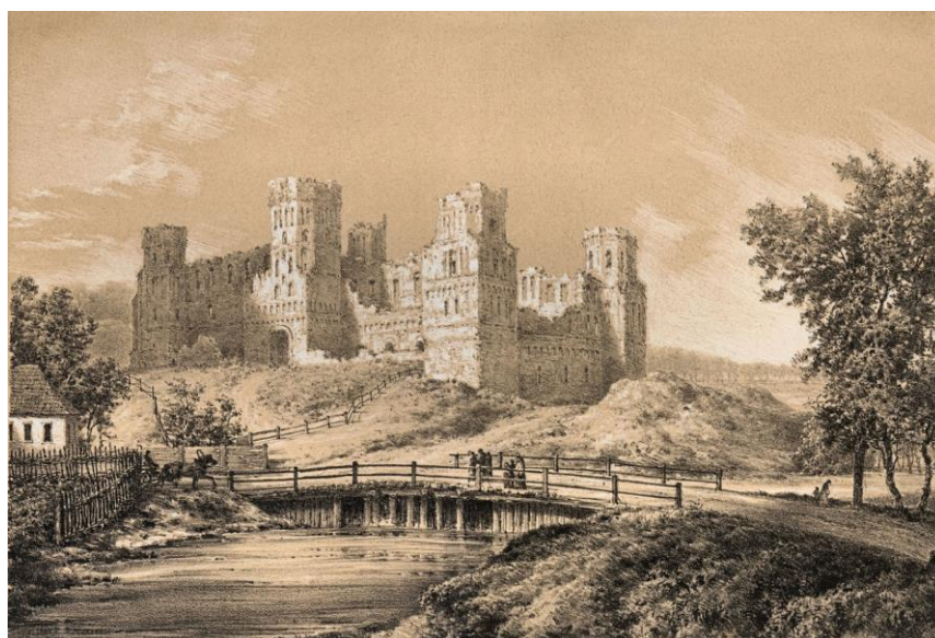
Ил. 2. Наполеон Орда. Мирский замок, 1876. Литография

В 1870-е годы Мирский замок со всеми пятью башнями запечатлел известный рисовальщик архитектурных памятников и пейзажей Наполеон Орда (ил. 2).