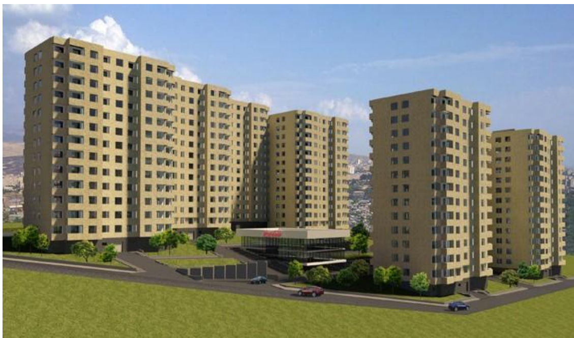
Fig. 1. Illustration of Right Urbanism.

→ Which neighborhood in the pictures below would you live in?