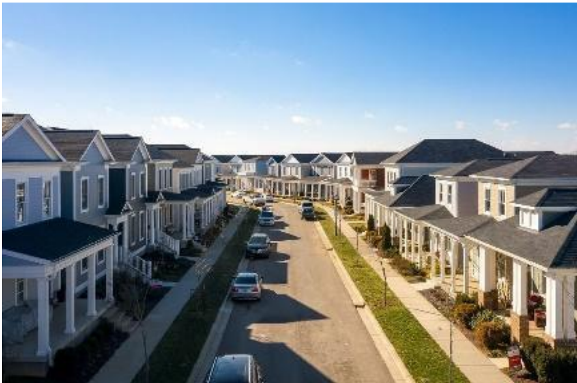
Fig. 3. Illustration of Left Urbanism.