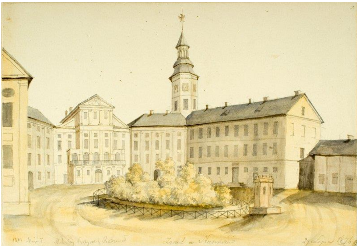
Ил. 4. Наполеон Орда. Несвижский замок, 1876.

Для Шпилевского характерен взгляд на замок как стороннего наблюдателя, он не оценивает обороноспособность замка, а смотрит на него с точки зрения исторической ценности, обязательной для посещения путешественника, интересующегося историей, который, несмотря на трудности дороги, должен подойти обязательно к этой руине: «Чтобы попасть из города в замок, нужно переезжать чрез озеро на лодке или же обходить почти две версты, чтоб выйти на плотину. И извне, и изнутри замок запущен: валы и насыпи полуразрушены и заросли купами лоз и лиственницы; вековые деревья одичали и остаются без надзора. Самый замок как-то мрачен и уныл с первого взгляда... Но не таков он был назад тому двести лет: в то время он был феноменом несвижского края» (Сырокомля, 2002, с. 76). (ил. 4, 5, 6)