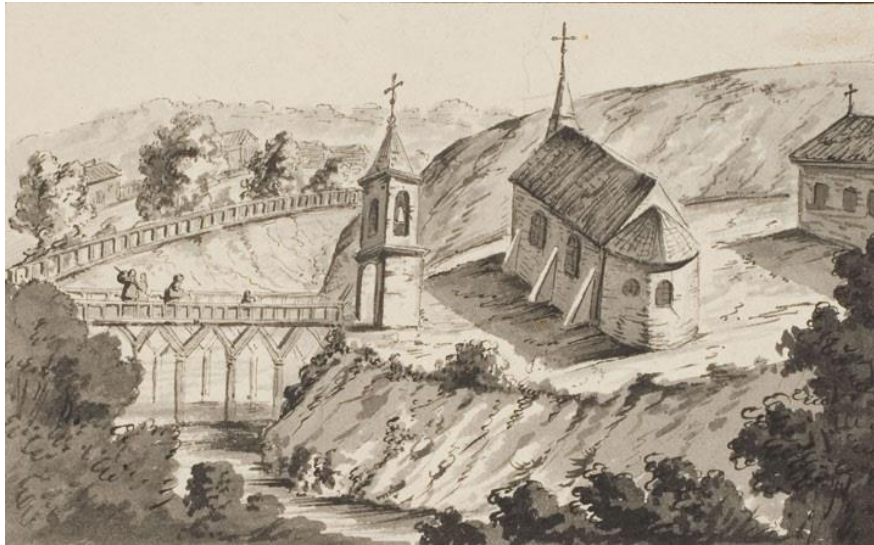
Ил. 8. Марцелий Янушевич. Церковь и монастырь базилиан. Логойск. Из фондов библиотеки Вильнюсского университета. Приб. 1857.

об истории Беларуси. Но в книге, посвящённой своему гравюрному собранию, Тышкевич имя Янушевича не называет (Тышкевич, 2020). Янушевичу посвящена биографическая статья в «Словаре литовских художников» (2012). Автор её литовский исследователь графики В. Гацюнас указал время появления художника в Вильно в 1814 году и 1857 год как начало работы Янушевича у Тышкевича. В 1871 году, в Дрездене, вышла книга К. П. Тышкевича «Вилия и её берега» с иллюстрациями М. Янушевича. (Gasiunas, 2012, p. 170–171) по результатам зарисовок в экспедиции по реке Вилии. Серию видов Логойска Янушевич, видимо, выполнил по заказу владельцев города и патронов художника графов Тышкевичей (ил. 8, 9).