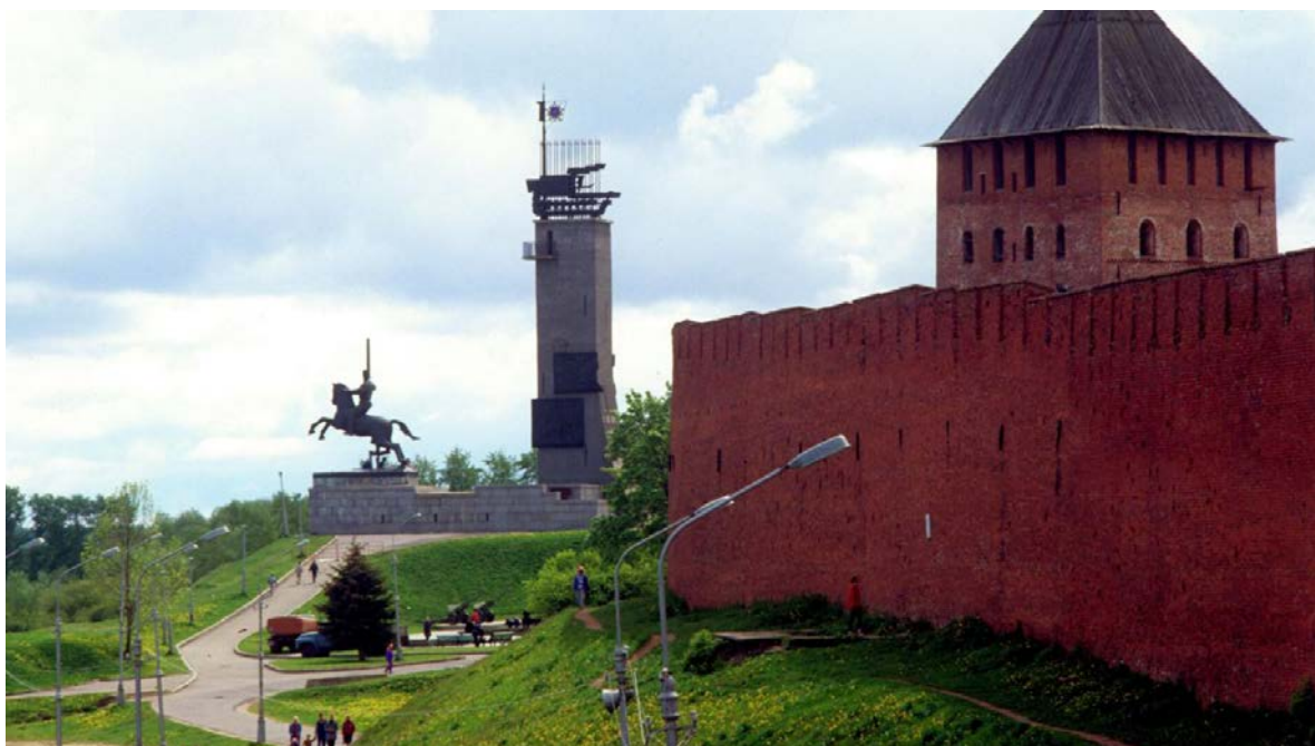
Ил. 10. Монумент Победы в Великой Отечественной войне Авторы-скульпторы Г. В. Нерода, А. Филиппова. Архитекторы А. Душкин, А. Сайковский.

1964, сс. 289–290). И сетует: «Теперь мы, конечно, пришли к пониманию, бережём, как можем <...> какая красота. Значит, и труд был великий, большое старание. <...> Ведь небось наши прадеды, самые что ни на есть серые мужички, всю эту прелесть сработали» (Паустовский, 1964, с. 290). Вот эта двойственность – практические, прагматические, сиюминутные решения по уничтожению исторического памятника, изменению облика города, а потом попытка сберечь, что останется, точно подмеченная писателем, нашла отражение в истории восстановления города 25 . В результате изменилась структура городского пространства. В кремлёвском парке были разобраны некоторые постройки XIX века, частично разрушенные в годы Великой Отечественной войны, Часовню Чудного Креста постигла та же участь. Исчезло с Екатерининской горки историческое здание, построенное специально для хранения подарка императрицы 26 , хотя оно потеряло только кровлю и перекрытие. А в 1974 году на этом месте был открыт Монумент Победы. Высотная композиция нарушила восприятие силуэта кремля, да и сам памятник не соответствует высокому художественному уровню.