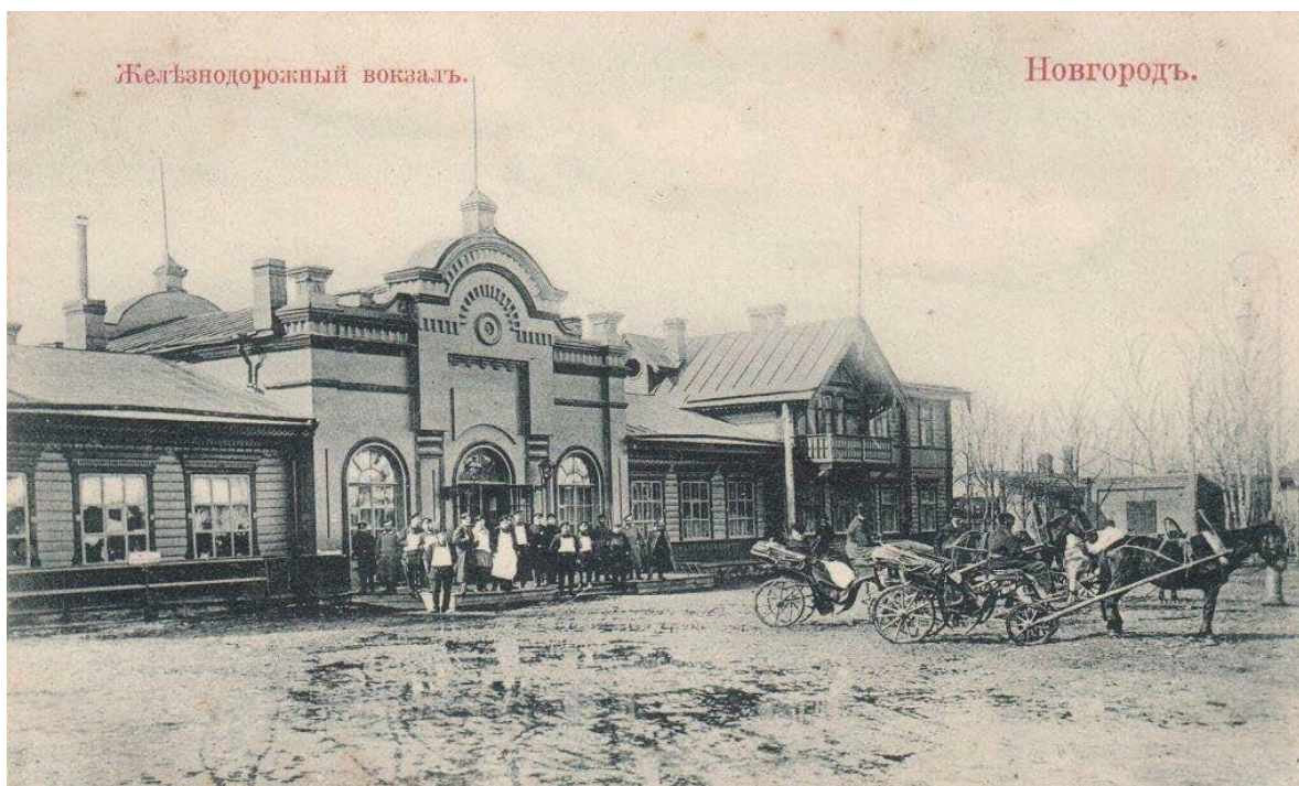
Ил. 1. Железнодорожный вокзал в Новгороде.

И вот наконец вокзал, «маленький, всегда безлюдный зелёный вокзал с его финиковыми пальмами и хрустящими скатертями в буфете» 6 (Паустовский, 1981 б, с. 285). Железнодорожный вокзал, построенный в 1872 году в Новгороде на средства петербургского купца первой гильдии И. А. Варгунина, стал достопримечательностью города. Деревянное нарядное здание вокзала в «русском стиле», с симметричной композицией, акцентированным фронтоном, большой площадью остекления окон, с разной этажностью, резьбой по дереву, подготавливало приезжающих к встрече с Новгородом, русским старинным городом 7 (ил. 1).