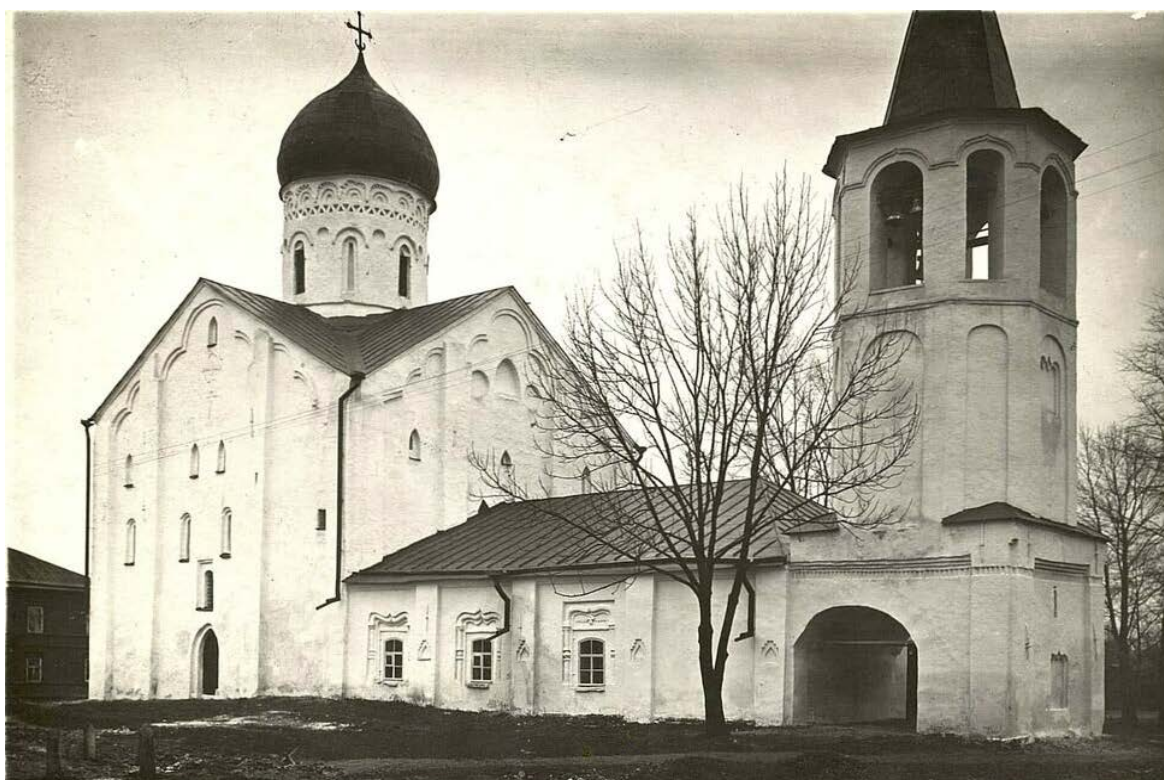
Ил. 7. Церковь Фёдора Стратилата на Ручью. Храм в 1935–1941 годах.