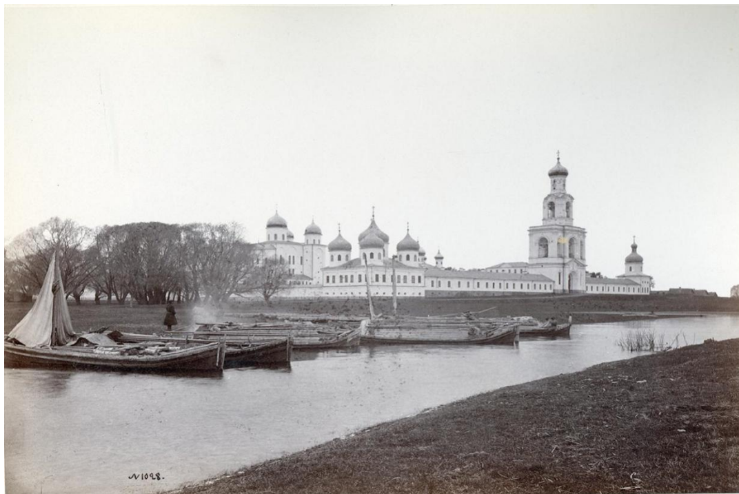
Ил. 8. Юрьев монастырь.

можно угореть до головной боли. Я здесь родилась, выросла, но в белые ночи мне никогда не верилось, что это всё настоящее. Ходишь по городу, будто под глубокой водой. <...> Когда я была девочкой, я уезжала белыми ночами в лодке на Ильмень 19 . <...> Выходила на сырой луг, смотрела на белые громады Юрьевского монастыря (ил. 8), жевала травинку, задумывалась. <...> Возвращалась только на рассвете» (Паустовский, 1981 б, с. 332). Не случайно заходит речь о Юрьевом монастыре, его очертания видны с моста через Волхов 20 .