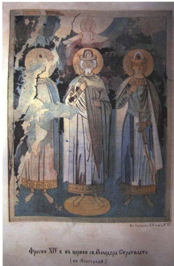
Ил. 3. Свв. Владимир, Борис и Глеб. Роспись церкви Феодора Стратилата. Акварель В. А. Прохорова. 1868 г.