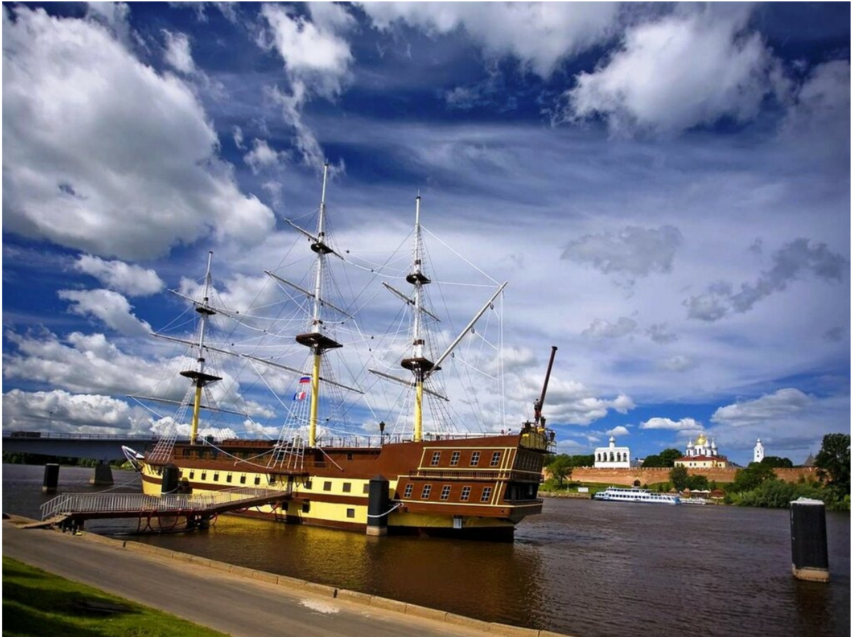
Ил. 11. Ресторанный комплекс Фрегат Флагман

В 2009 году на Волхове, на Торговой стороне напротив Кремля IX века, установлен крупномасштабный фрегат – плавучий ресторан (ил. 11). Даже то, что он представляет собой копию 66-пушечного фрегата «Святой Апостол» XVIII века не снимает вопрос: как можно было допустить присутствие в самом сердце города с тысячелетней историей и богатейшим культурным наследием такое заведение?