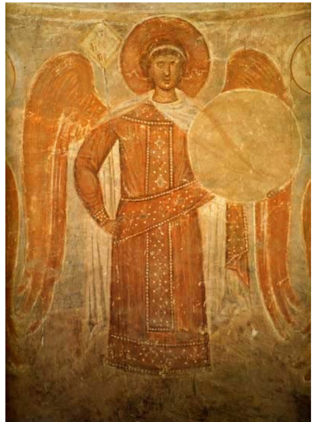
Ил. 4. Фрески XIV в церкви Фёдора Стратилата на Ручью. Архангел

Вермель мечтал написать книгу о красках, каждой краске мечтал отвести главу, которую он снабдил бы секретами приготовления, отклонениями в историю, оптику, в законы солнечного спектра. Он утверждал, что прочность красок зависит от штукатурки, — надо было узнать её состав, для чего положил в карман своей знаменитой чёрной бархатной куртки кусочек штукатурки.