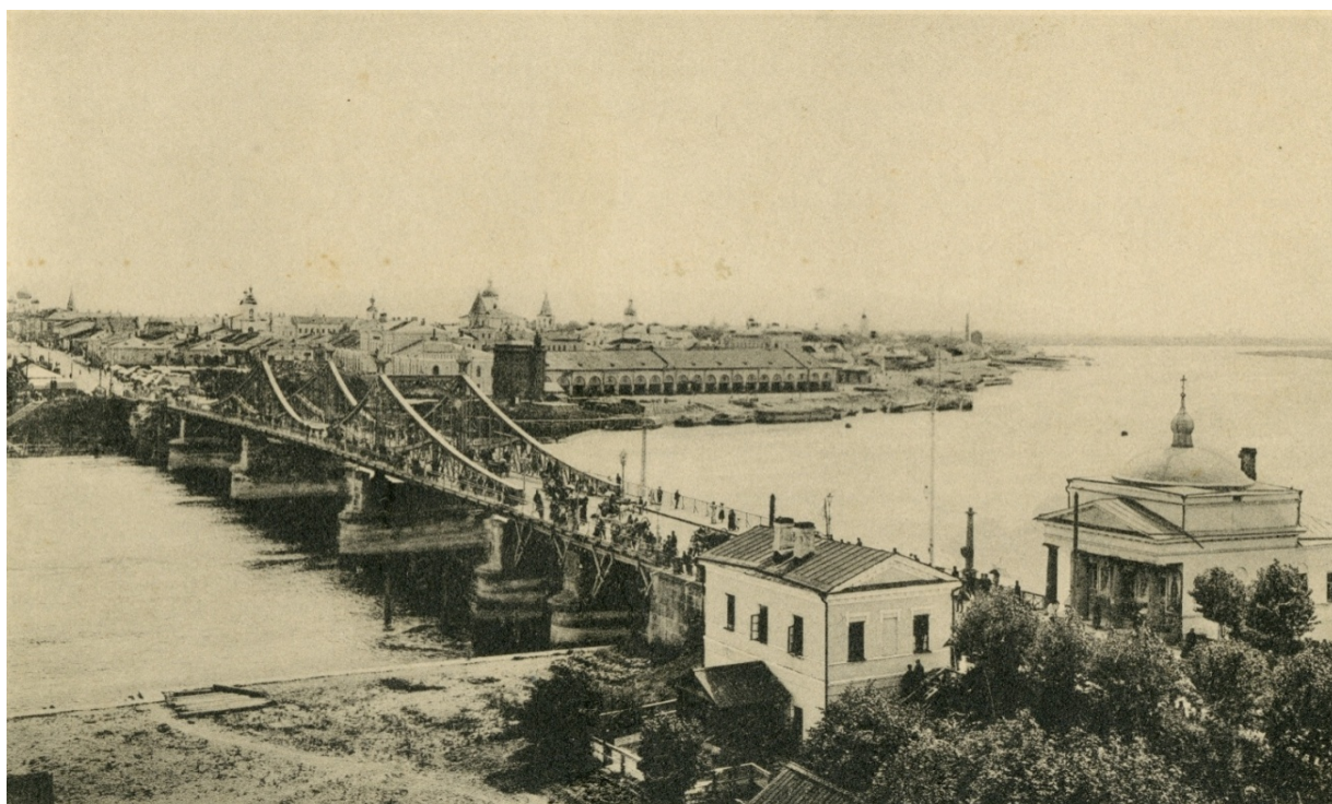
Ил. 5. Довоенный мост через Волхов.

довоенного Новгорода соединял пятипролётный железный мост с высокими фермами на семи опорах, построенный по проекту инженера Г. Н. Соловьёва в 1898 году (ил. 5).