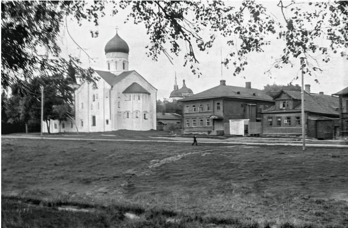
Ил. 9. Новгород. 1930-е годы. Справа дом с мезонином. Слева церковь Фёдора Стратилата на Ручью