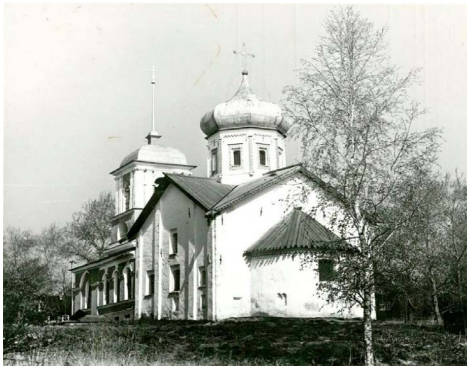
Ил. 2. Церковь Святой Троицы.

стояли ещё короткие. В три часа уже темнело. Только над одной избой курился дымок. Все остальные избы будто вымерли. Каждый раз Пахомов, подходя к церкви, останавливался и смотрел на её строгие стены, глубокие оконца, низкие почернелые купола. Сквозь ржавчину просвечивало их красноватое золото.